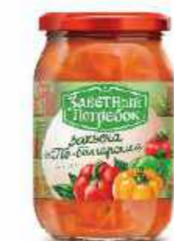
ЗАКУСКА ПО-БОЛГАРСКИ 500 г

Фасовка: твист, стекло Кол-во в упаковке: 12 Срок годности: 12 месяцев 🌡️ от 0 °С до +20 °С