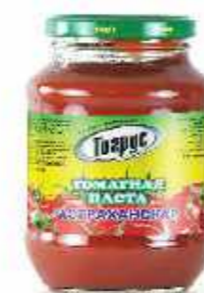
ТОМАТНАЯ ПАСТА АСТРАХАНСКАЯ 500 г

Фасовка: туба, пластик Кол-во в упаковке: 24 Срок годности: 1 год 🌡️ от 0 °С до +20 °С