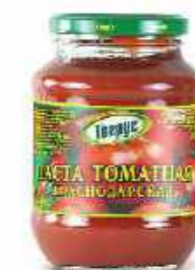
ТОМАТНАЯ ПАСТА КРАСНОДАРСКАЯ 500 г

🪴 Вес при фасовке в ведро: 1100 г 🪴 В упаковке: 6 шт.