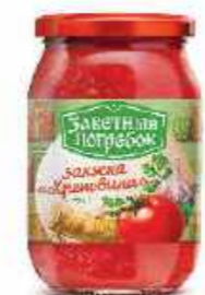
ЗАКУСКА ХРЕНОВИНА 500 г

Фасовка: твист, стекло Кол-во в упаковке: 12/6 Срок годности: 12 месяцев 🌡️ от 0 °С до +20 °С