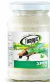
ХРЕН СТОЛОВЫЙ 190 г

🪴 Вес при фасовке в ведро: 1100 г 🪴 В упаковке: 6 шт.