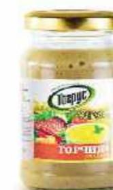
ГОРЧИЦА РУССКАЯ 190 г

Фасовка: твист, стекло Кол-во в упаковке: 8 Срок годности: 1 год 🌡️ от 0 °С до +20 °С