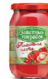
ТОМАТНАЯ ПАСТА 500/1000 г

Фасовка: твист, стекло Кол-во в упаковке: 15 Срок годности: 1 год 🌡️ от 0 °С до +20 °С