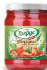
ТОМАТНАЯ ПАСТА 25-27% 280/500/1000 г

Горчица и хрен «Тогрус» – острые приправы, которые идеально подходят для рыбных и мясных блюд.