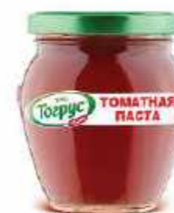
ТОМАТНАЯ ПАСТА 25-27% 600 г

Фасовка: твист, стекло Кол-во в упаковке: 8 Срок годности: 2 года 🌡️ от 0 °С до +20 °С